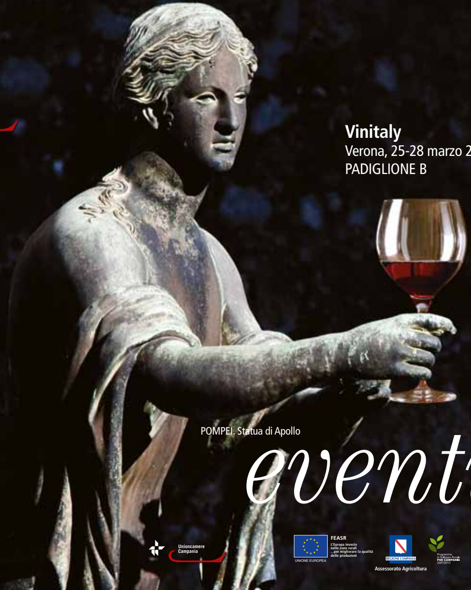
POMPEI. Statua di Apollo

Vitaly Verona, 25-28 marzo 2012 PADIGLIONE B